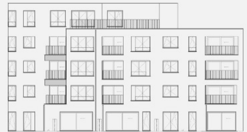
ACHTERGEVEL OUDE SCHAAPMARKT