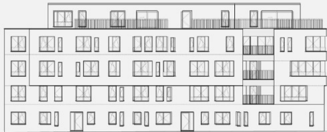
VOORGEVEL OUDE SCHAAPMARKT